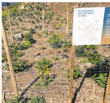
Aufforstung mit „klimafitten“ Bäumen: ein Beispiel in Lans.

dar und verschlechtern die Sicherheitslage des Lebensraumes massiv. Daher ist eine vorausschauende und naturnahe Gebirgswaldbewirtschaftung zur Stabilisierung und eine Anreicherung der Wälder mit Mischbaumarten extrem wichtig. Die Nachfrage nach trockenheits- und wärmetoleranten „klimafitten“ Baumarten steigt deshalb rasant an.