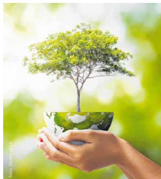
Der ARGE ALP-Klimaschutzpreis holt Umweltschutz- und Nachhaltigkeitsprojekte vor den Vorhang.

Weitere Informationen unter www.argealp.org