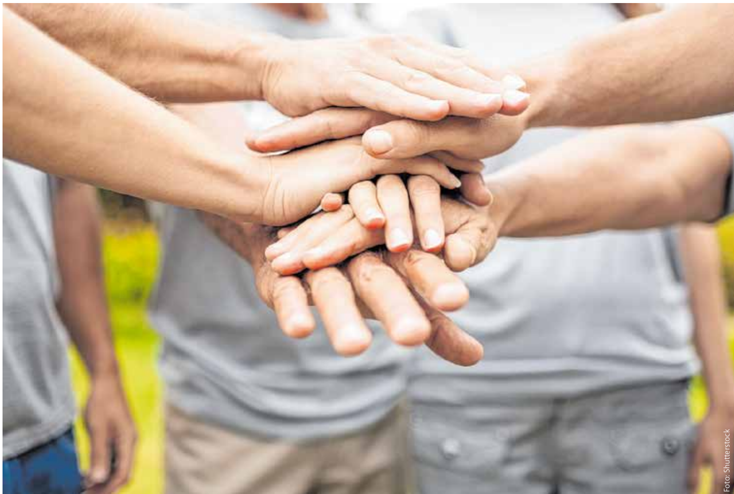
Gemeinsame, länderübergreifende Projekte stärken die Zusammenarbeit in der ARGE ALP.